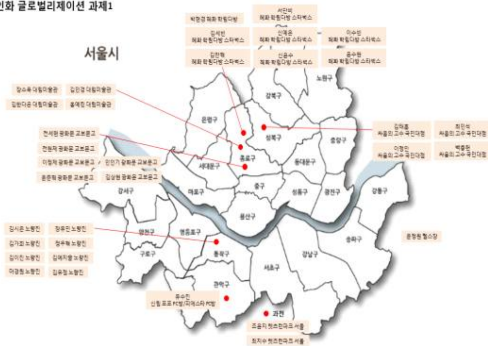
근대 개인화 글로벌리제이션 과제1