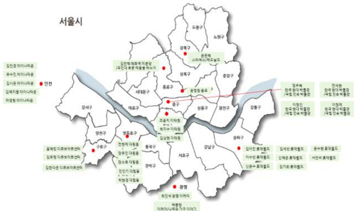
근대 개인화 글로벌리제이션 과제2