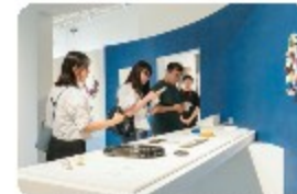
서울공예박물관 전시 관람