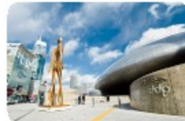
DDP(동대문 디자인 플라자)