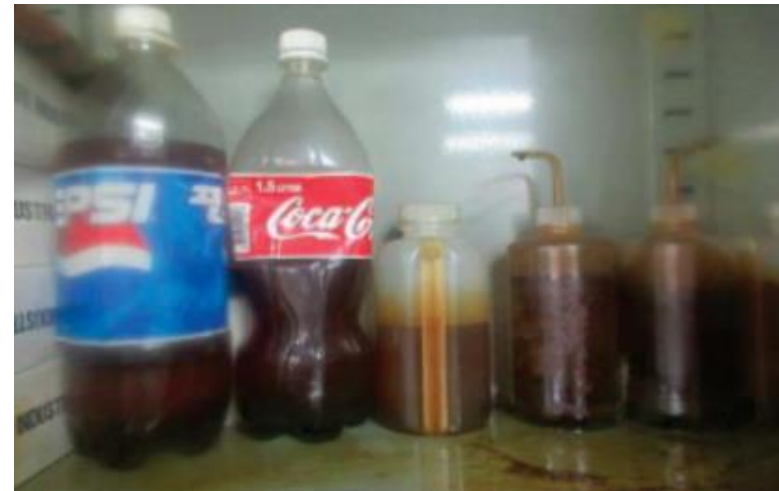
- 음용용기 시약 보관