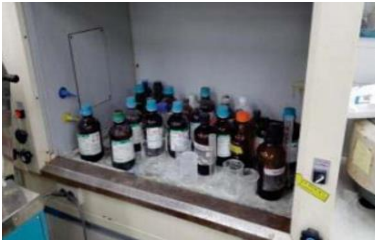
- 흡후드내 시약 다량 보관/ 전용시약장 보관