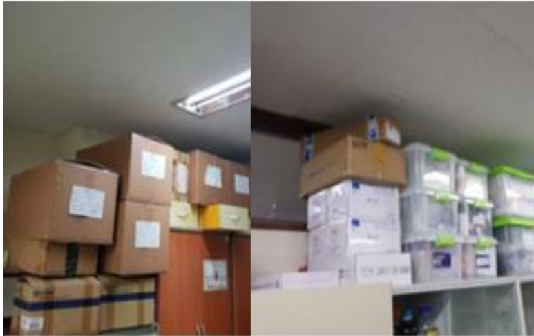
- 선반 상부 기자재 비치