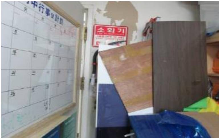
- 소화기 관리(위치) 불량