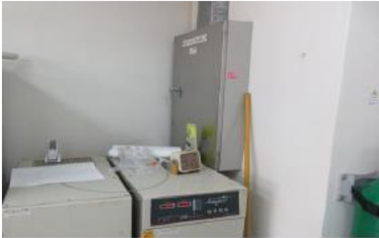
- 분전반 앞 기자재 비치