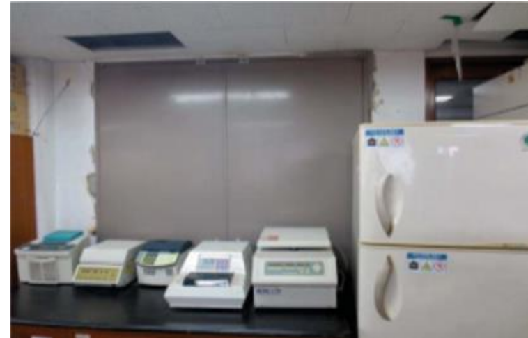
- 피난구 앞 기자재 비치