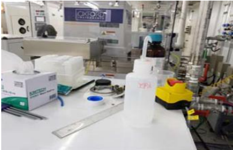
- 시약병 경고표지 및 라벨 미부착