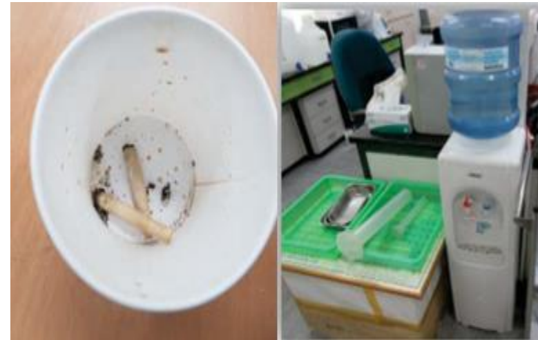
- 연구실내 음식물 섭취/흡연 금지