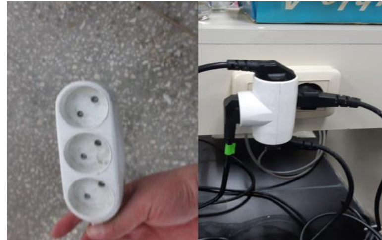
- 비접지형 콘센트/문어발식 사용