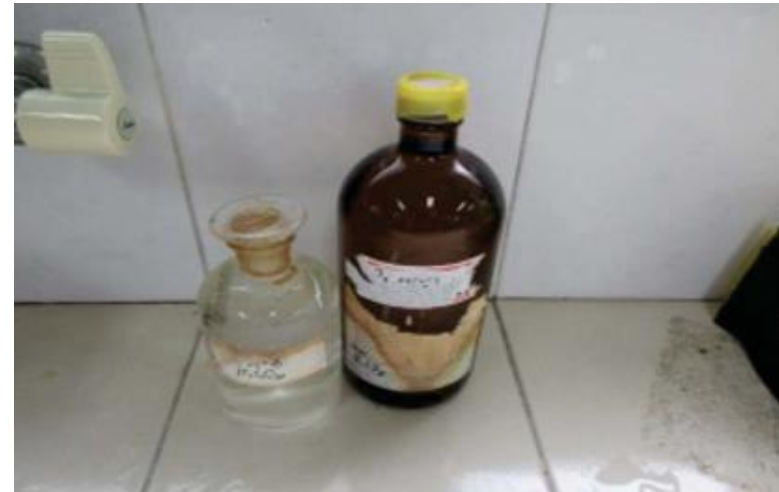
- 미사용 시약 장기간 보관 /라벨 손상