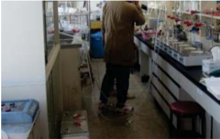
- 실내 이동통로 미확보