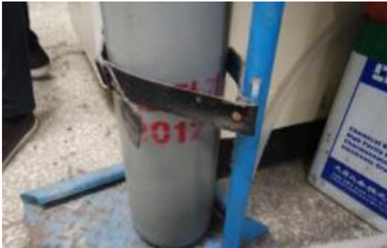
- 가스용기 충전기한 경과