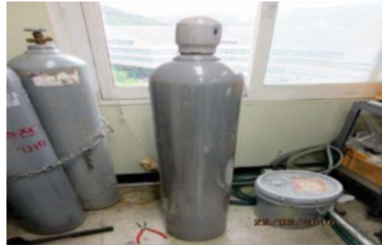
- 전도장치장치 미설치