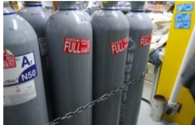
- 전도방지장치 공동체결