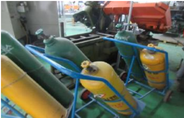
- 미사용 용기 보호캡 미설치