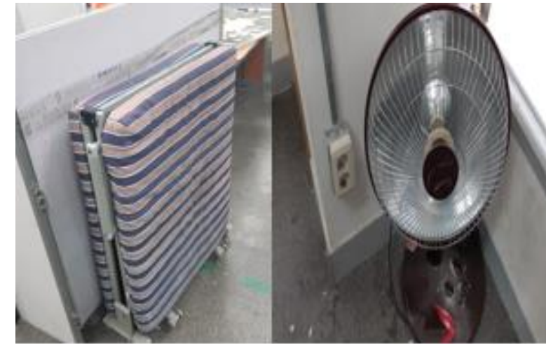
- 연구실내 취침/전열기 사용