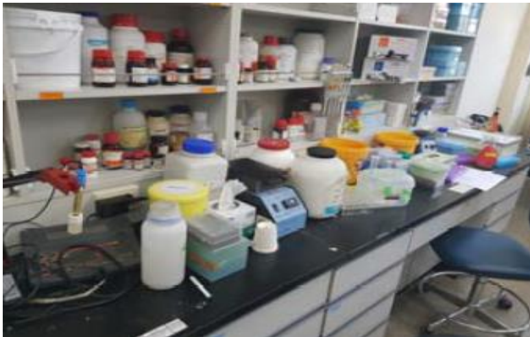
- 정리정돈 불량