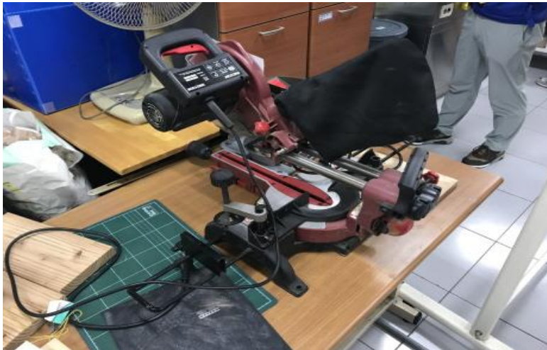
- 장비사용설명서 및 안전수칙 미게시