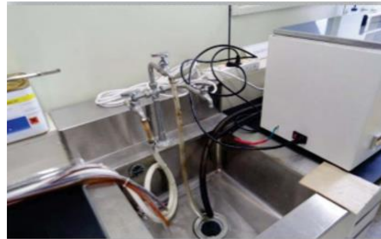
- 개수대 주변 전기 사용