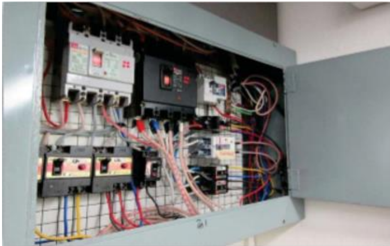
- 분전반내 절연덮개 미부착/용도기재