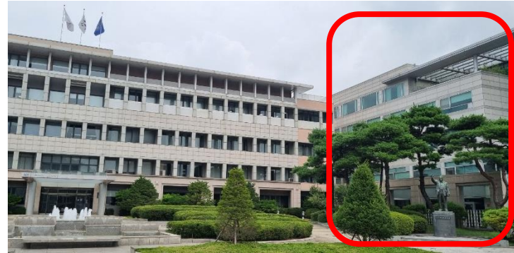
② 동상 뒤 건물(법학관) 방향으로 이동