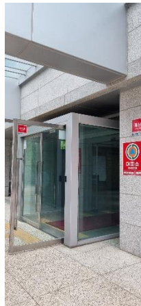
③ 법학관 건물로 입장 후 좌회전