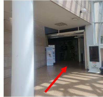
② 콘서트홀 입장 후 우회전하면 경영관으로 연결