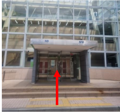
① 콘서트홀 입장