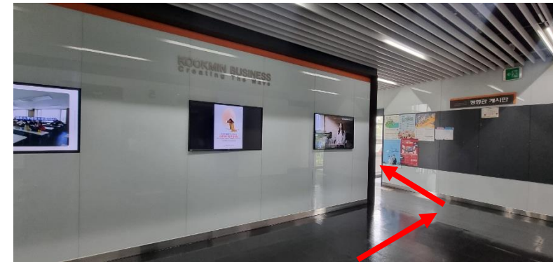
④ 경영관 5층에서 하차 후 우회전 (엘리베이터 문이 열리면 위와 같은 모니터 3개가 보임)