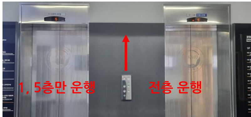
③ 경영관 1층에서 엘리베이터 탑승 후 5층으로 이동