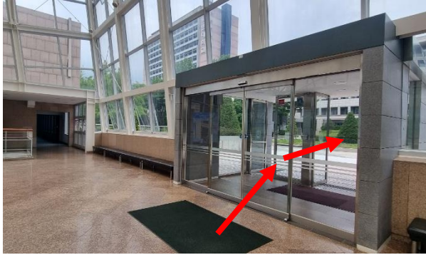
① 건물 밖으로 퇴장 후 우회전