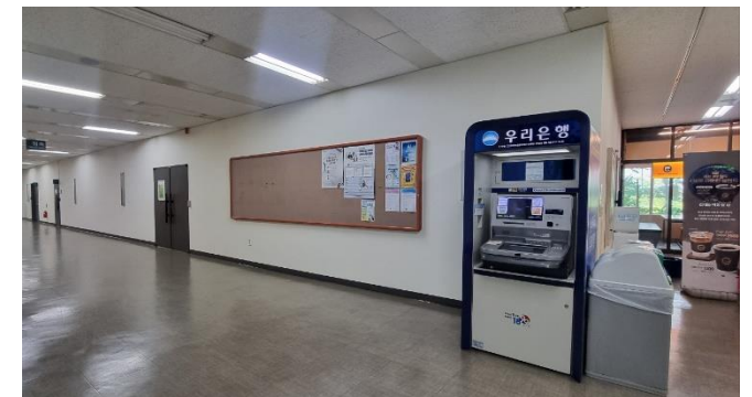
④ 좌회전 직후